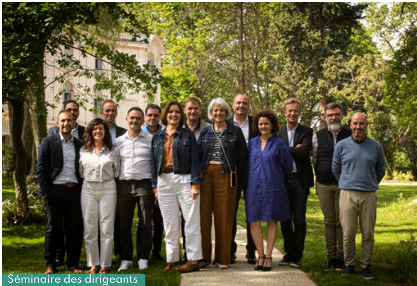
Séminaire des dirigeants