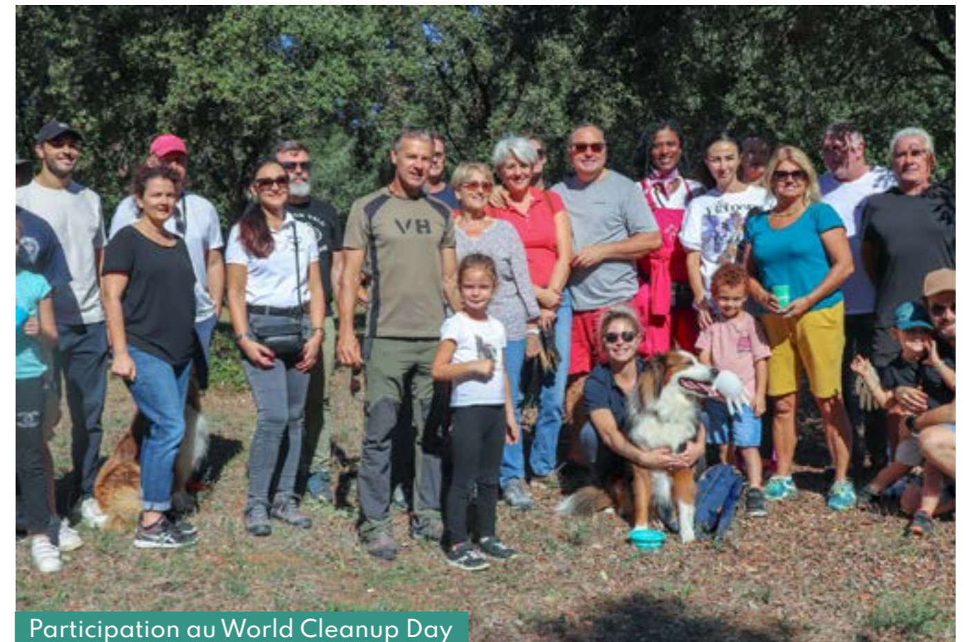
Participation au World Cleanup Day