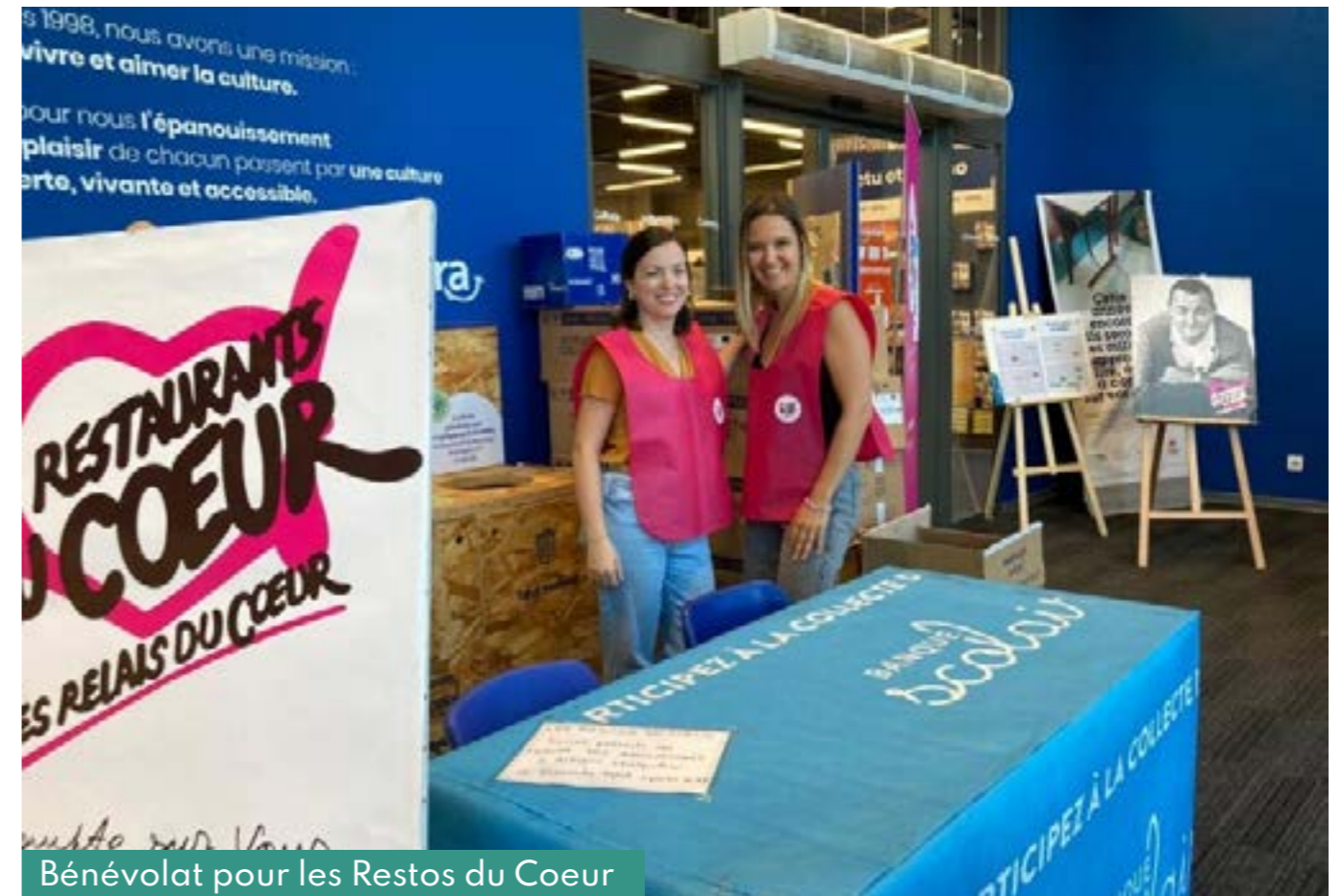
Bénévolat pour les Restos du Cœur

Site internet, LinkedIn Vidéo sur notre statut de société à mission Signature du Mouvement des Jours d'Engagement au Travail par Vendredi