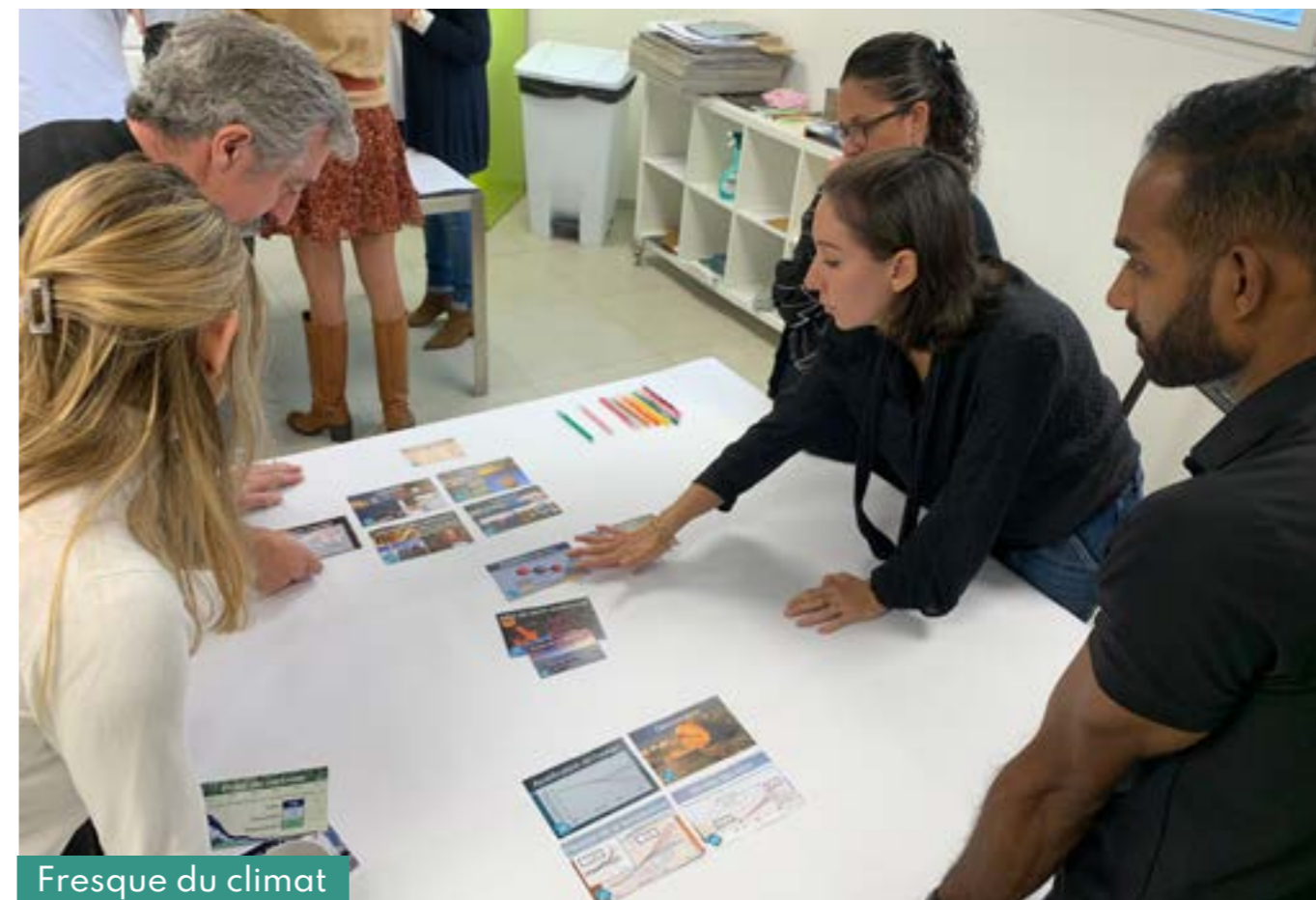
Fresque du climat

En tant qu'actionnaire majoritaire et actif, EODEN accompagne ses filiales pour les faire évoluer et prospérer