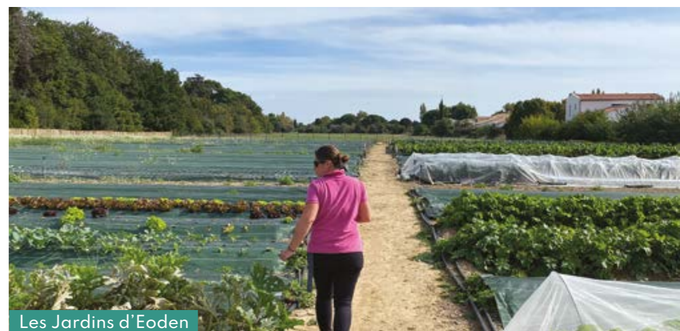
Les Jardins d'Eoden

Aménagement d'une parcelle agricole de 8000m 2 en maraîchage sur sols vivants, en collaboration avec l'agroforesterie afin d'augmenter la biodiversité et la biomasse : ruches, gallinacées, compostage naturel, etc.