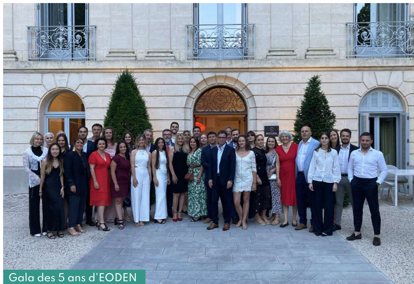
Gala des 5 ans d'EODEN