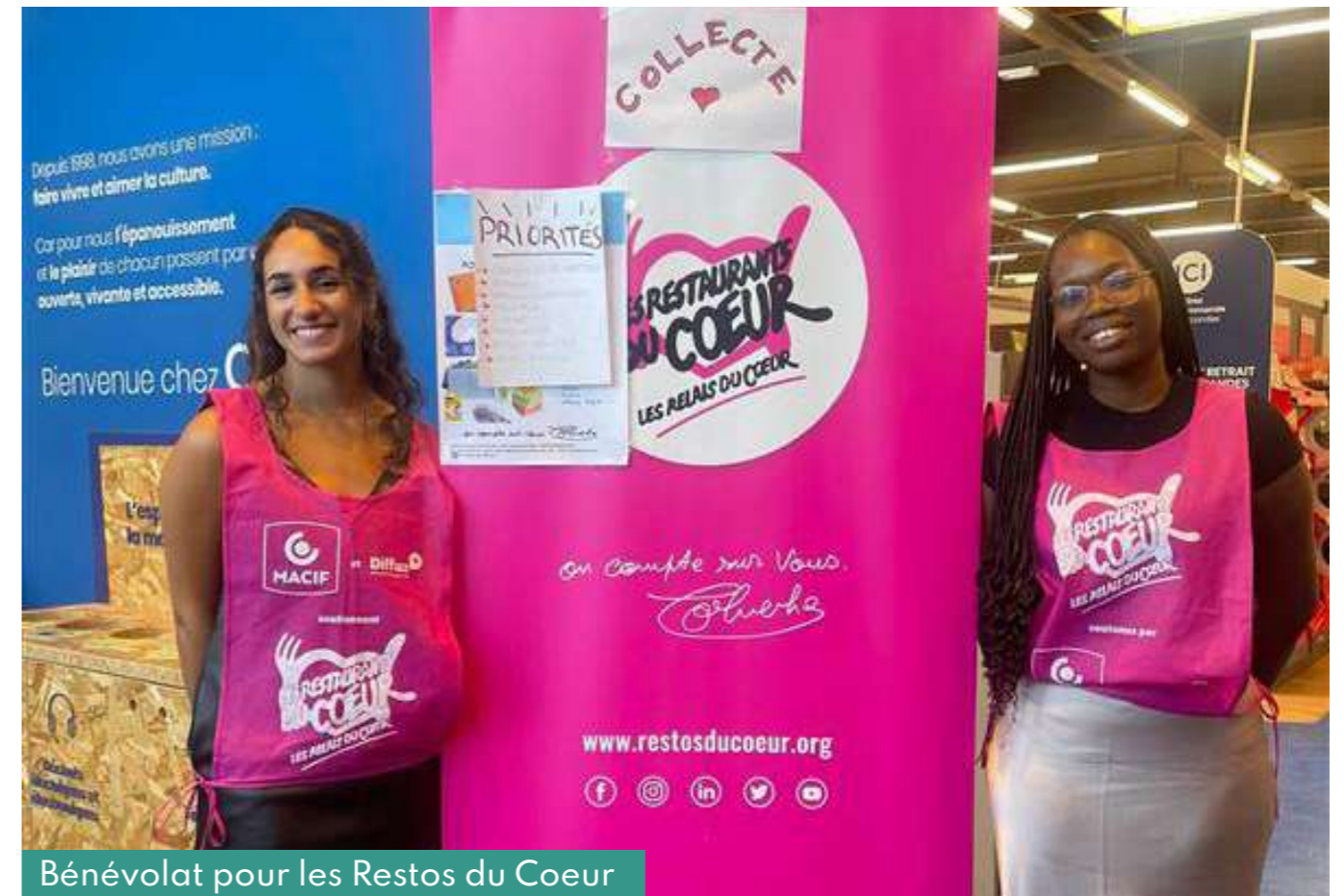
Bénévolat pour les Restos du Coeur