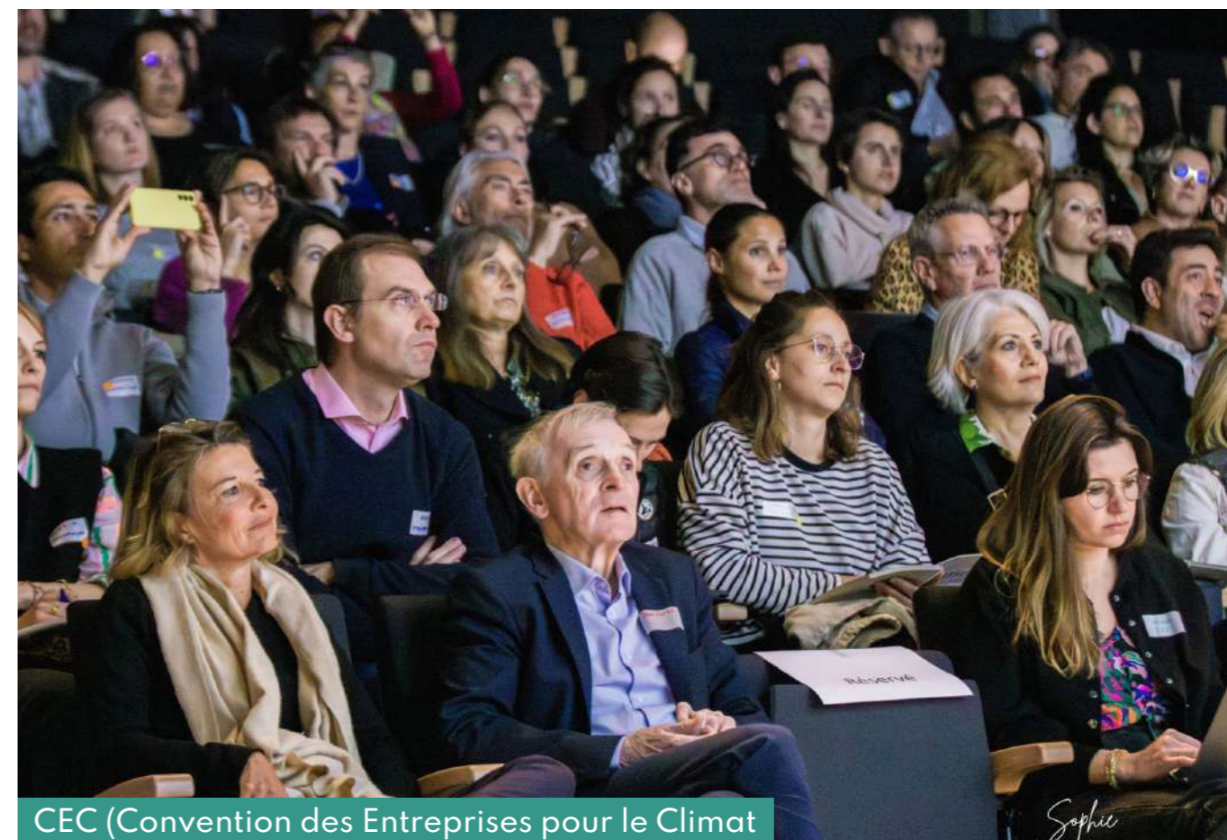
CEC (Convention des Entreprises pour le Climat)