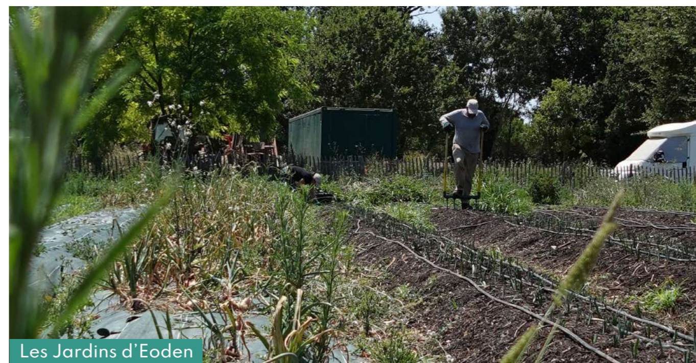
Les Jardins d'Eoden

Les Jardins d'EODEN contribuent à la captation carbone grâce au maraîchage en sols vivants.