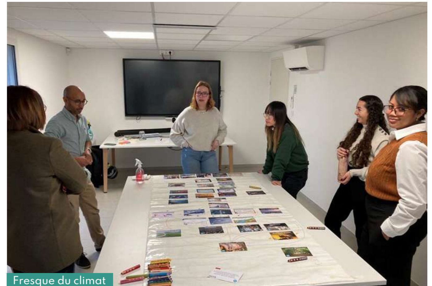
Fresque du climat