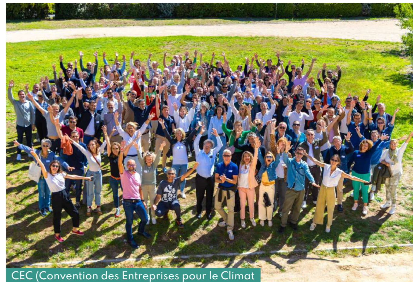
CEC (Convention des Entreprises pour le Climat)